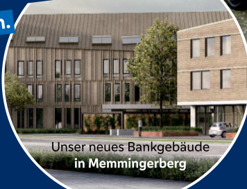
Unser neues Bankgebäude in Memmingerberg

Damit unsere Region lebens- und liebenswert bleibt.