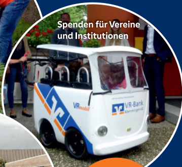
Spenden für Vereine und Institutionen