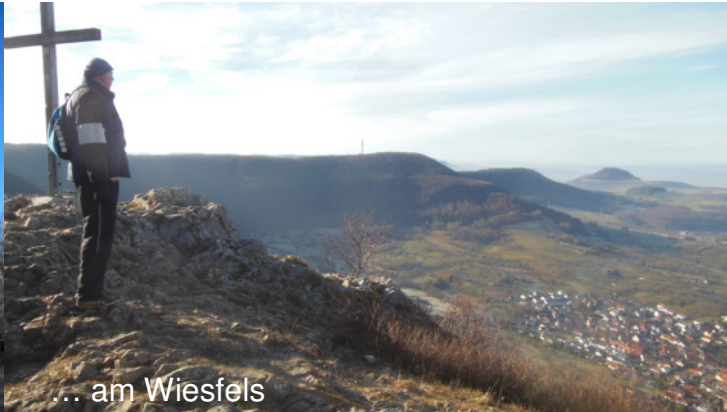
... am Wiesfels