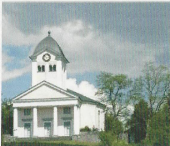
Rundkirche Oberneisen: Kirchspiel -