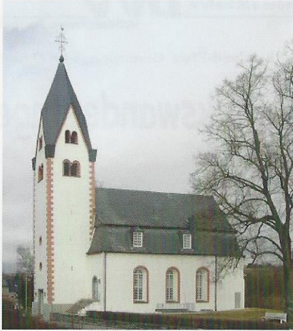
Flacht: Kirchspiel -