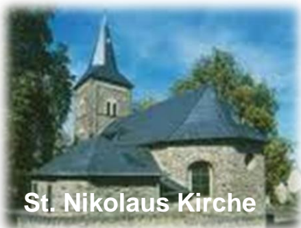
St. Nikolaus Kirche