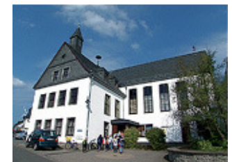
Gemeindeforum Horn Start & Ziel

Der TuS Horn hat in diesem Jahr keine aktuelle Auszeichnung, Auszeichnungen der vergangenen Jahre können erwandert werden.