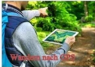
Wandern nach GPS