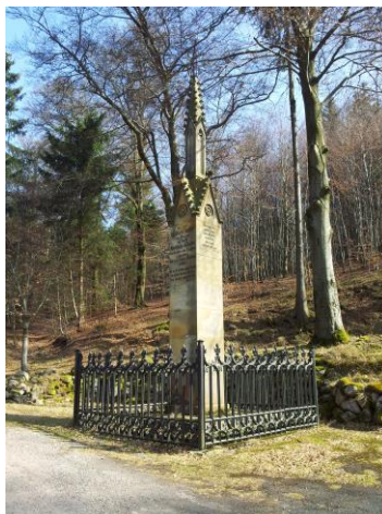
Luthers Entführungsort Glasbachgrund