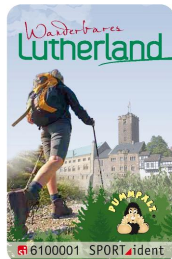
Wandern mit Luther-Chip