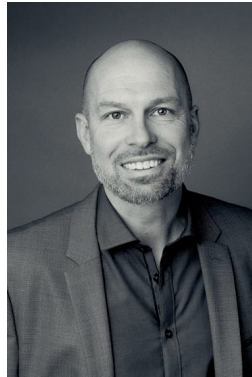
Timo Wangler Bürgermeister

Allen Wanderfreunden wünsche ich schöne Stunden in Ketsch, viel Vergnügen und unvergessliche Augenblicke auf Schusters Rappen!