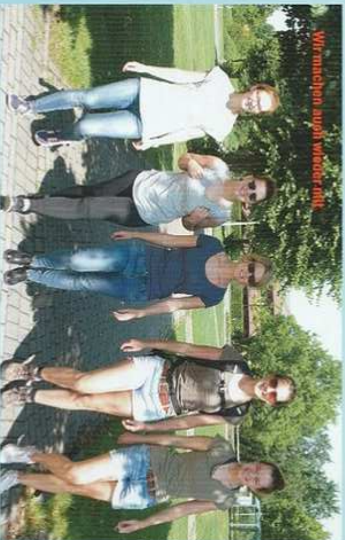
Wir machen auch wieder mit!