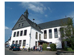
Gemeindehaus Horn Start & Ziel

Auskunft erteilt: Gerd Knebel – Poststraße 1 - 55469 Horn 06766/969896 - abt.wandern@tus-horn.com - www.tus-horn.com