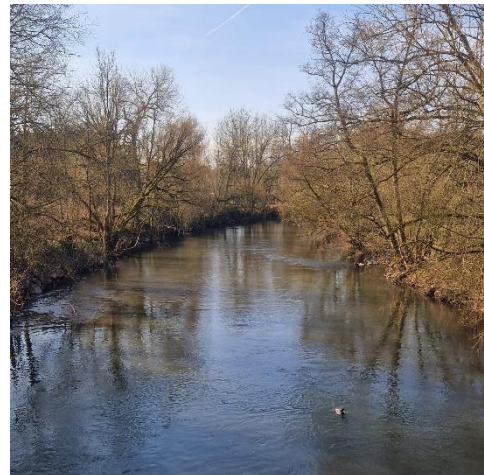
Blick auf die Prims

Alle Teilnehmer erhalten eine Startkarte. Kinder und Jugendliche bis 16 Jahre frei!