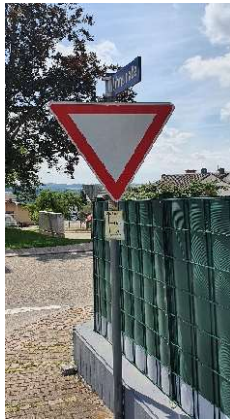
6. Trennung 2