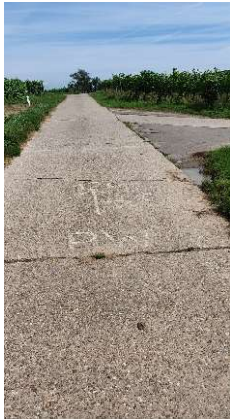
5. Trennung 1