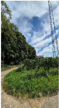
10. Beim Sendemast