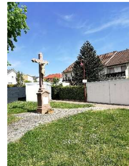
1a. Fußweg Im Horenzacker

Wir gehen den Kapellenpfad hoch und den geraden Weg weiter bis zum Aneresels Kreuz (2.) . Hier gehen wir nach rechts die Steigung hoch, bis zum nächsten asphaltierten Weg, zweimal nach links gehend erreichen wir die Letzenbergkapelle (3.) . Wir bleiben auf diesem Weg und erreichen die Hauptstraße am Ortseingang Malschenberg, Hauptstraße überqueren und nach rechts gehen, nach ca. 100m erreichen wir ein Wegkreuz (4.) , hier links abbiegen. Nach ca. 200m kommen wir zur Streckentrennung (5.) .