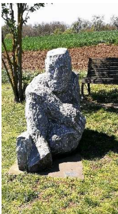
17. Ruhende Kraft