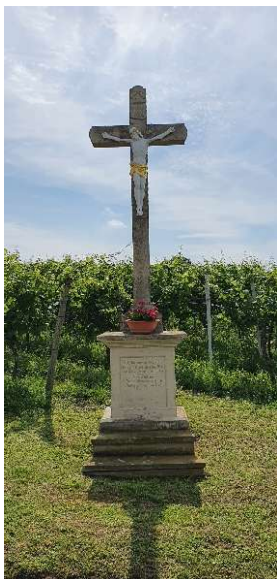
2. Aneresels Kreuz

Wir gehen die Pfalzstraße gerade weiter hoch bis zur Hauptstraße, hier gehen wir nach rechts, der Hauptstraße folgend erreichen wir wieder das Bäckerei-Cafe Senger, Start und Ziel 2.